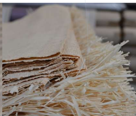
Hydroflam® Ignifuges fabriqués en France