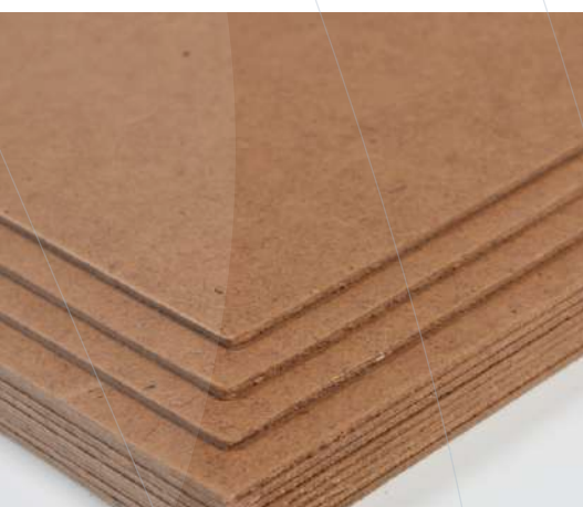
Fibroflam® Panneaux ignifugés en bois & dérivés

Fabrication de produits ignifuges | Protections ignifugées Panneaux ignifugés | Ignifugation de matériaux Peintures & vernis ignifuges | Finitions non-déclassantes