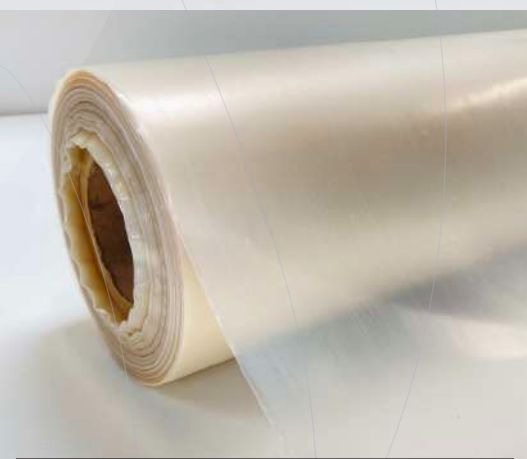
Plastiflam® Protections ignifugées souples