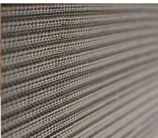
Flamboard® Cartons ignifugés