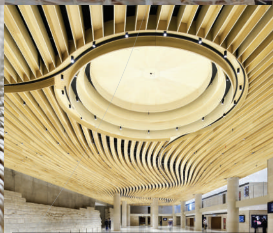
Verniflam® Vernis & peintures intumescentes